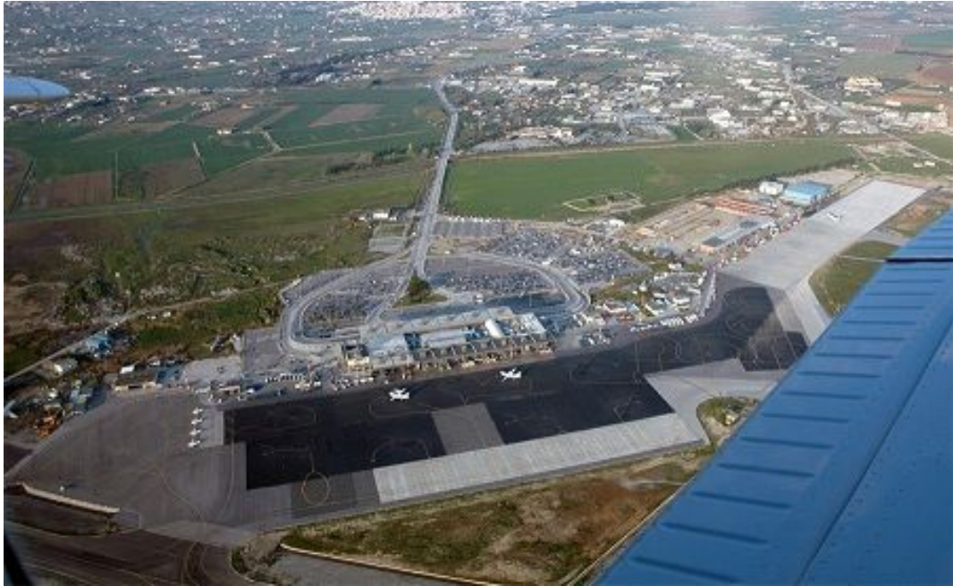
Γενική άποψη του δαπέδου στάθμευσης, του αεροσταθμού και του εμπορευματικού σταθμού του ΚΑΘΜ