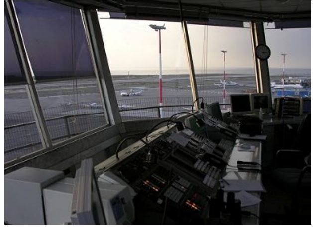
Άποψη του πύργου ελέγχου του ΚΑΘΜ