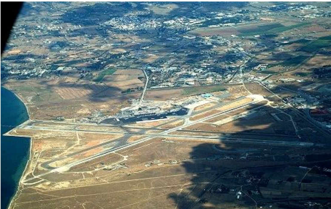
Γενική άποψη του ΚΑΘΜ

Ο Κρατικός Αερολιμένας Θεσσαλονίκης «ΜΑΚΕΔΟΝΙΑ» (ΚΑΘΜ) βρίσκεται στην ακτή της «κοιλιάδας του Ανθεμούντα», νοτιοανατολικά της Θεσσαλονίκης και σε απόσταση 16 χλμ από το κέντρο της πόλης καταλαμβάνει έκταση 5.400 στρεμμάτων και εντός του χώρου του εδρεύει και μια μονάδα της Πολεμικής Αεροπορίας με πυροσβεστικά αεροσκάφη. Λειτουργεί όλη τη διάρκεια του έτους, σε 24ωρη βάση και διαθέτει 2 διασταυρούμενους διαδρόμους, τον 16/34 (2410 m x 60 m) και τον 10/28 (2440 m x 50 m), οι οποίοι συνοδεύονται από παράλληλους τροχοδρόμους πλάτους 23 m. Οι προσεγγίσεις στο διάδρομο 16 υποστηρίζονται από σύστημα ενόργανης προσέγγισης σε συνθήκες μειωμένης ορατότητας (ILS CAT II) ενώ οι αντίστοιχες του διαδρόμου 10 από ILS CAT I. Το δάπεδο στάθμευσης αεροσκαφών έχει συνολικό εμβαδόν περίπου 231.000 m 2 και διαθέτει 22 διαγραμμισμένες θέσεις αεροσκαφών αερογραμμών καθώς και θέσεις αεροσκαφών γενικής αεροπορίας