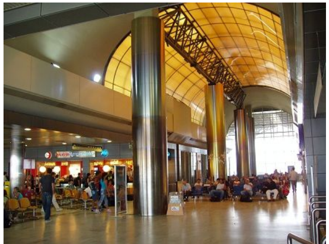
Άποψη εσωτερικών χώρων αεροσταθμού ΚΑΘΜ

Ο έλεγχος εναέριας κυκλοφορίας του ΚΑΘΜ παρέχεται από 38 ελεγκτές εναέριας κυκλοφορίας (Ιούλιος 2011) που είναι κατανεμημένοι σε τρία τμήματα: έλεγχος αεροδρομίου, έλεγχος προσέγγισης και γραφείο αεροναυτικών πληροφοριών και ενημέρωσης πληρωμάτων. Από το 2000, οπότε και έγινε η εγκατάσταση και λειτουργία του τερματικού Ραντάρ (PSR/MSSR) στην περιοχή της Περαιάς, παρέχεται έλεγχος ραντάρ προσέγγισης. Μέχρι τότε ο έλεγχος προσέγγισης ήταν διαδικαστικός.