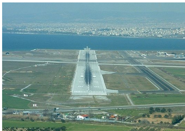
Προσέγγιση στο διάδρομο 34 του ΚΑΘΜ

Ήδη έχει ξεκινήσει η εγκατάσταση συστήματος Ραντάρ Επιφανείας (SMR) που πρόκειται να συμβάλλει στη βελτίωση της λειτουργίας του αερολιμένα σε συνθήκες μειωμένης ορατότητας ενώ η επέκταση του διαδρόμου 10/28 κατά 1000 μ στην πλευρά της θάλασσας θα δώσει άλλες δυνατότητες στο αεροδρόμιο.