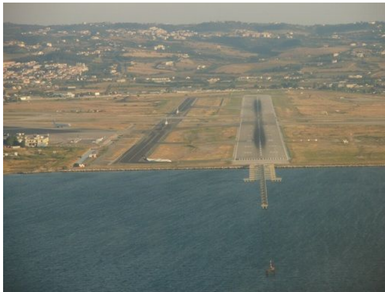
Προσέγγιση στο διάδρομο 16 του ΚΑΘΜ